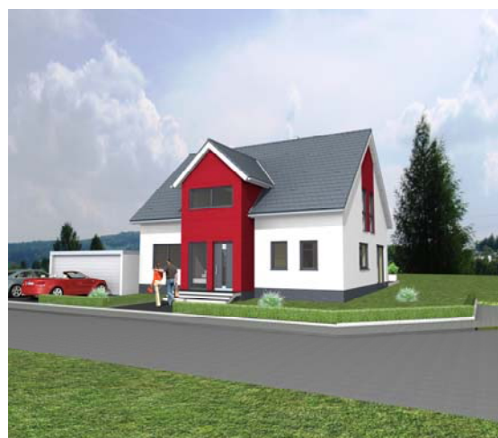
Beispiel: Massivhaus 218

■ Freie Planung nach Ihren Wünschen und Vorstellungen – Ihr Haus individuell geplant und umgesetzt! Neben unseren Typenhäusern können natürlich Einfamilienhäuser, Bungalows, Doppelhäuser, Zweifamilienhäuser oder auch Mehrfamilienhäuser ganz nach Ihren Wünschen angeboten und realisiert werden.