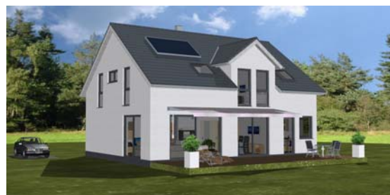
Beispiel: Haus Armin

Die wirtschaftliche Lage, die günstigen Zinssätze und ein durchdachtes Konzept sind der Garant für eine gute Anlage in Wohnimmobilien. Die Suche nach einem geeigneten Baugrundstück in der richtigen Lage und die Auswahl einer leistungsfähigen Hausbaufirma sind dabei besonders wichtig.